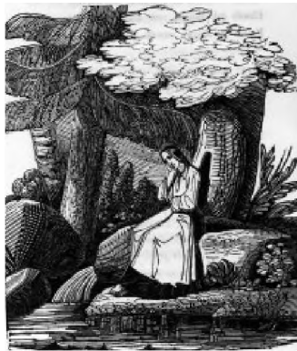
Ilustracje Wincentego Smokowskiego do dzieła Kraszewskiego: Anąfielas. Pieśni z podań Litwy