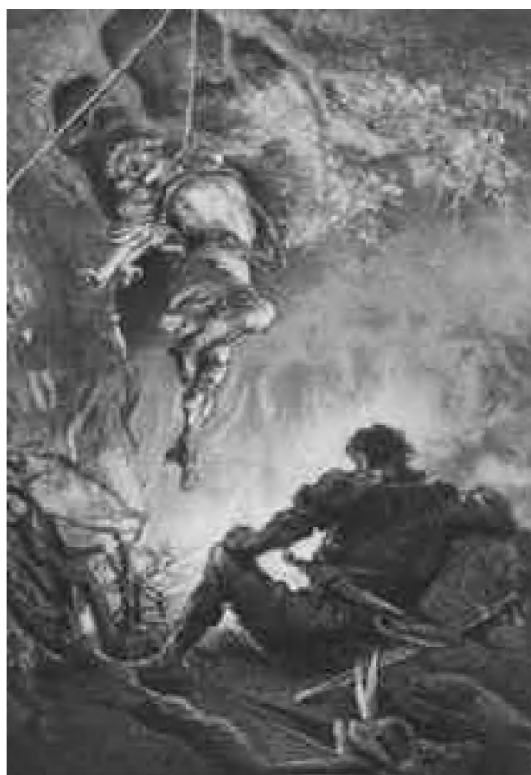
„Ogień [...] podkładając, aby Hengo upiekł mu się żywcem.” – ilustracja Michała Elwiro Andriollego do Starej baśni