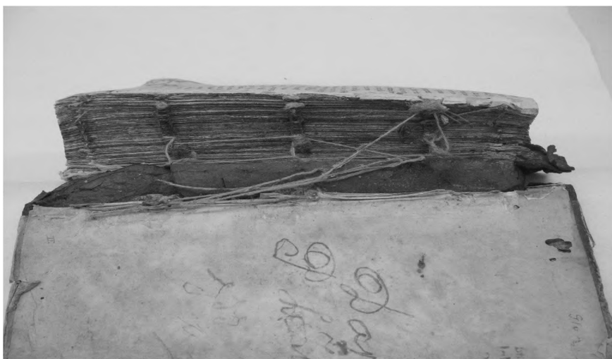
„Gazeta Warszawska”. Widok zniszczonego grzbietu.

Starodruki przedstawiają dużą wartość historyczną i kulturalną, są dziedzictwem narodowym, które należy zachować w jak najlepszym stanie. W ramach projektu przeprowadzane są wszechstronne zabiegi konserwatorskie. Ich celem jest powstrzymanie dalszych zniszczeń fizyko-chemicznych oraz przywrócenie funkcji użytkowych publikacjom przy jak najwierniejszym zachowaniu i odtworzeniu elementów oryginalnych. Materiały będą również zdigitalizowane i zamieszczone w Podlaskiej Bibliotece Cyfrowej. W Książnicy odbędzie się wystawa prezentująca proces konserwacji, a na stronie internetowej biblioteki już zamieszczono fotogalerię.